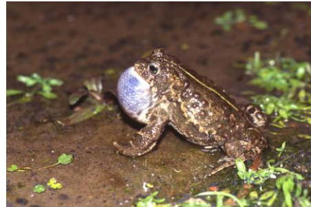
Rugstreepad ( Bufo calamita )