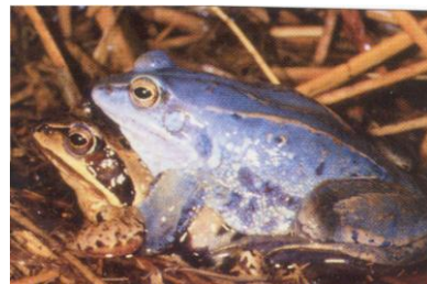
Heikikker ( Rana arvalis )