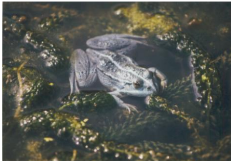
Groene kikker ( Rana esculenta ) (blauw door het ontbreken geel pigment)